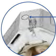
Presa aria di rinnovo

La presa d'aria di rinnovo dell'unità interna rende l'aria più salubre e confortevole