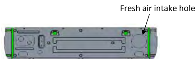
Fresh air intake hole

E' possibile immettere una percentuale di aria esterna e miscelarla attraverso un foro pretranciato presente sull'unità interna